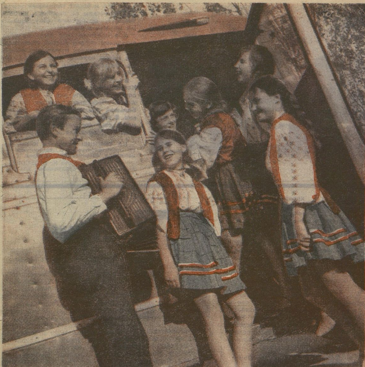
Готовы костюмы, разучены песни и танцы. Автобус нагружен подарками. Можно ехать к друзьям! Пione-ров 6-й школы молдавского города Рыбницы ждут октябрятка села Мокра. — Прощайте! Попрощай, поповай, о делах своих поговорим. Чтобы не забылась эта встреча, вместе посадили у школы аллею Дружбы!